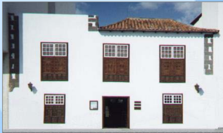
Centro Científico-cultural Blas Cabrera.1995.2004.