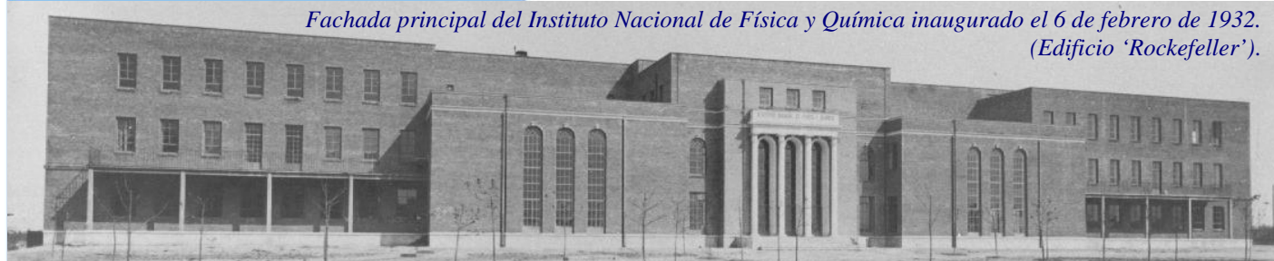
Fachada principal del Instituto Nacional de Física y Química inaugurado el 6 de febrero de 1932. (Edificio ‘Rockefeller’).

Catedrático de Fundamentos Físicos de la UPM Autor de varios libros sobre Blas Cabrera