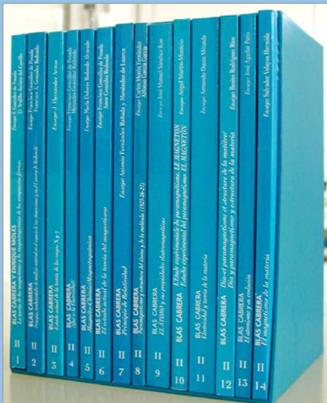
Obras completas comentadas: sus libros.