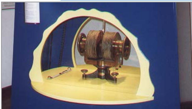
Electroimán de Blas Cabrera. Museo de Ciencia y Técnica. Centro Científico-cultural Blas Cabrera.1995.2004.